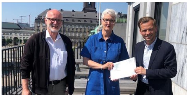
Evaluering af dagpengereformen

Vi ønsker dig god læselyst og en rigtig god sommer!